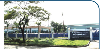
Nhà Máy Miền Nam