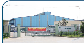
Nhà Máy Miền Bắc